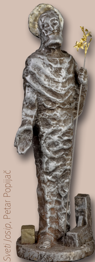
Sveti Josip, Petar Popijač